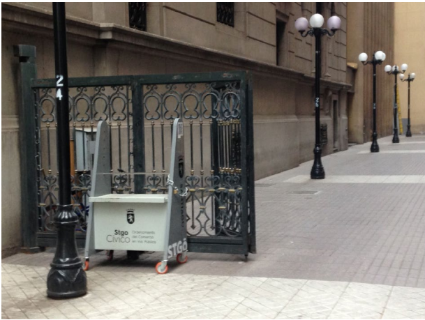
Imagen 5. Mobiliario municipal para comercio informal autorizado abandonado en paseo Huérfanos