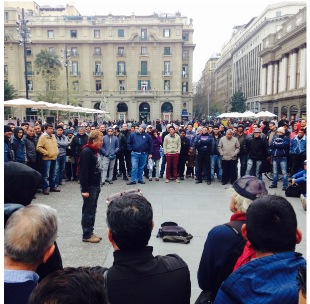
Imagen 3. Humorista en Plaza de Armas

Por su parte, los comerciantes informales autorizados también se las ingeniaron para aprovechar de mejor manera los beneficios que le son otorgados. En ese sentido, fue bastante común ver la figura del “colero”, la cual consiste en un segundo o tercer vendedor que se instala al costado del puesto del comerciante autorizado, a modo de extensión informal de éste (ver imagen 6). De esta manera, dos o tres personas “comparten” un solo permiso, lo que les permite, entre otras cosas, abaratar los costos de su renovación o facilitar que alguien quede al cuidado del puesto en caso alguno salga. Esta situación suele darse con mayor frecuencia en las personas en situación de discapacidad, ya que por un lado, éstos suelen requerir ayuda para la instalación y desinstalación del mobiliario, además de alguien que les proporcione mayor seguridad, ya que según ellos suelen ser víctimas de robos. Mientras que a su vez, los “coleros” se benefician de compartir el permiso, el cual se les otorga con mayor facilidad a las personas en situación de discapacidad. De esta forma, este tipo de prácticas van desdibujando la frontera de lo formal e informal, dificultando una vez más la regulación y control de este escurridizo y resiliente fenómeno que se ha dado en los centros históricos durante décadas.