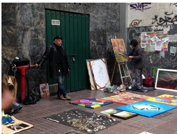
Imagen 2. Artista urbano en Paseo Huérfanos

incluso (en el caso de los “pañoleros” 8 ) para realizar corredores que según ellos mismos estrechan el paseo, disminuyen la velocidad de los transeúntes e incitan a que más personas se fijen en sus productos y aumenten sus ventas (ver imagen 1).