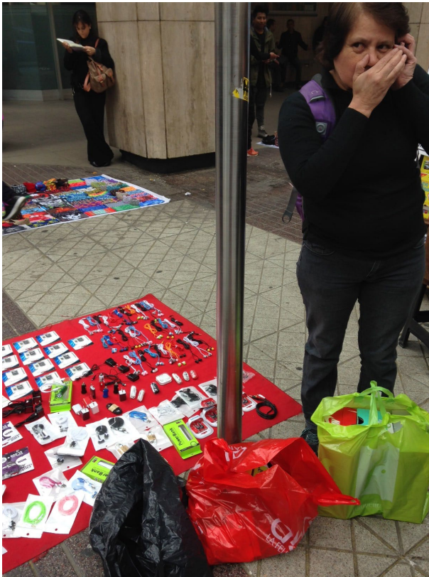
Imagen 1. Pañolero en calle Estado