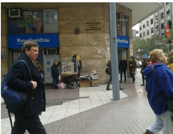
Imagen 6. Comerciante autorizado y colero en Paseo Huérfanos