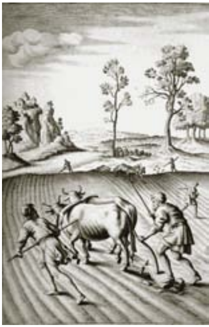
1. Ilustración para Las Geórgicas de Virgilio. Michael Van Der Gucht, c. 1702. Pergamino, 29,5 x 20 cm.