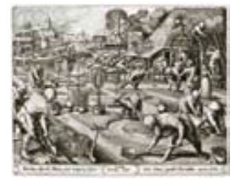
6. Primavera. Pieter van der Heyden sobre Pieter Bruegel el Viejo, 1570. Grabado. National Gallery of Art, Washington.

de es fácil reconocer la matriz del parterre, que una vez despojado de coles y calabazas se contoneará en libertad en el jardín francés del barroco.