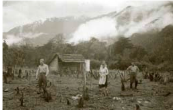
4. Colonizadores de Aysén , c. 1934.

calendarios agrícolas medievales que especifican las labores a realizar en cada estación llevan en honor de las diosas el nombre de “Libro de Horas”: son las precauciones que deben guardarse para que la agricultura pueda sobrevivir a la incertidumbre del tiempo, sabiendo leer la regularidad de su transcurso. La precisa unidad cronométrica que hoy damos por inefable, toma su nombre de las labores o trabajos que inicialmente en cada estación y después en cada momento del día, fueron ordenando una existencia productiva (y luego ritual). El conocimiento de la sucesión regular del clima –a diferencia de lo voluble e impreciso del tiempo– permite sobrellevar la praxis agrícola en medio de la naturaleza.