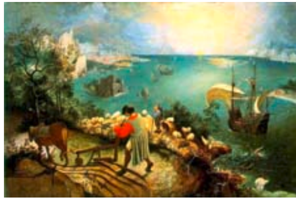
2. Paisaje con la caída de Ícaro . Pieter Bruegel, c. 1558. Óleo sobre tela, 73,5 x 112 cm. Musees Royaux des Beaux-Arts de Belgique, Bruselas.