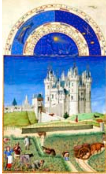
3. Septembre. Les Très Riches Heures du Duc de Berry . Paul Hermann y Jean Limbourg, 1412 – 1416. Museo Condé, Chantilly.