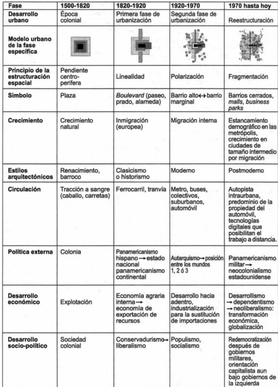
Figura 2. Diagrama sinóptico del desarrollo urbano, político, social y económico en América Latina desde la época colonial hasta hoy .