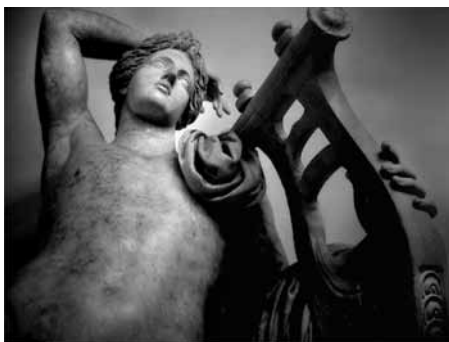
Figura 6. En la tradición artística, la representación del dios Apolo con la cítara como atributo se conoce como "Apolo Citaredo". Detalle del Apolo Citaredo de los Museos Capitolinos, s. II, anónimo romano.

en su obra, incluyendo este texto, que comienza con ese tono "antiguo" tan característico de Rojas: "Cítara mía, hermosa/ muchacha...".