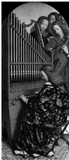
Figura 13. En este detalle del conocido políptico La Adoración del Cordero Místico , de Hubert y Jan van Eyck (1432), los ángeles tocan diversos instrumentos celebrando la gloria de Dios.

Los ángeles músicos representan los mediadores de la "Música de las esferas", aunque más cargados de connotaciones cristianas, pues expresan la divinidad creadora y la música celestial. Por lo general aparecen tocando instrumentos de cuerda (con todas las connotaciones que este hecho conlleva), pero pueden aparecer tocando casi cualquier instrumento, incluso los más presentes en la vida cotidiana. En cualquier caso, los ángeles con su música cantan la gloria de Dios y la armonía del cielo, de los cuales son su representación.