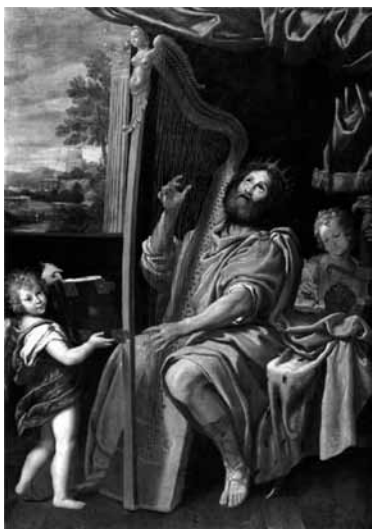
Figura 14. El rey David tocando el arpa (1619-1620), de Domenichino.