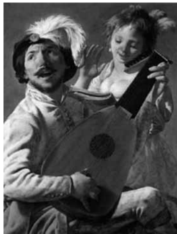
Figura 12. Duetto (1628), de Hendrick Terbruggen, es un buen representante de la línea también flamenca del siglo XVII del burdel, la ebriedad y la carnalidad, que refleja a menudo parejas o grupos de personas tocando instrumentos y cantando, con connotaciones claramente eróticas.

Esta misma línea erótica y de goce sensible fue enfatizada por otros autores como Søren Aabye Kierkegaard, que la relacionaba con el placer, la seducción y lo demoníaco 4 .