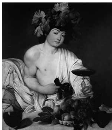
Figura 8. En este famoso Dionisos (1594) de Caravaggio se ve reflejada la "riqueza frutal" del poema de Rojas.