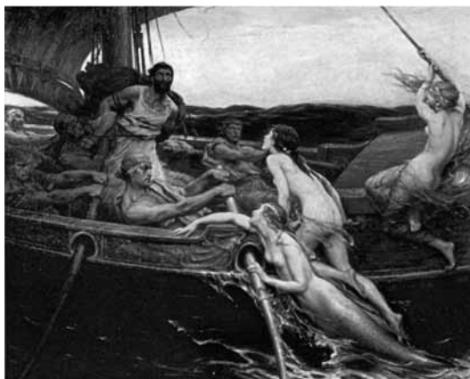
Figura 10. Ulises no pudo resistirse a escuchar el canto de las sirenas y se hizo atar al mástil de su barco por sus compañeros, como cuenta La Odisea . La historia ha sido representada frecuentemente en la pintura, siendo el cuadro de Herbert J. Draper Ulises y las sirenas (1909) uno de los más conocidos.

las sirenas (Figura 9), constituyen casos en los que la música tiene el poder de someter a la voluntad, de ofrecer al ser humano los placeres inmediatos que irremisiblemente lo condenarán.