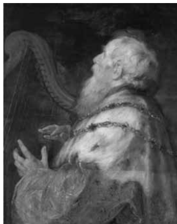
Figura 15. El rey David (1616), de P.P. Rubens.