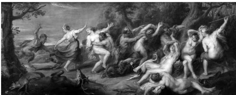
Figura 9. La velocidad (el ritmo frenético), la desnudez o el deseo amoroso-erótico ("arrebato velocísimo", "desnudémonos ya", "libertad de animales desnudos") encuentran su reflejo pictórico en Diana y sus ninfas sorprendidas por sátiros (1670), de Rubens.

las sirenas (Figura 9), constituyen casos en los que la música tiene el poder de someter a la voluntad, de ofrecer al ser humano los placeres inmediatos que irremisiblemente lo condenarán.