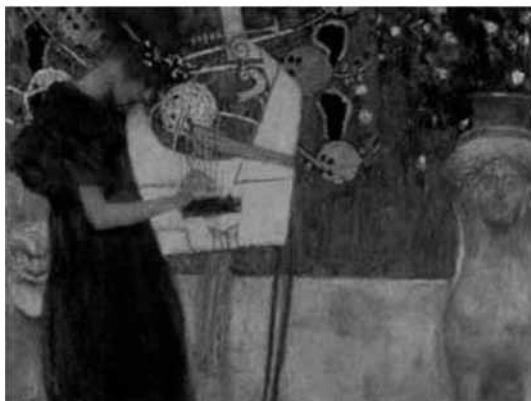
Figura 4. En La Música (1895), de Gustav Klimt, el instrumento elegido para la alegoría es en este caso una cítara.