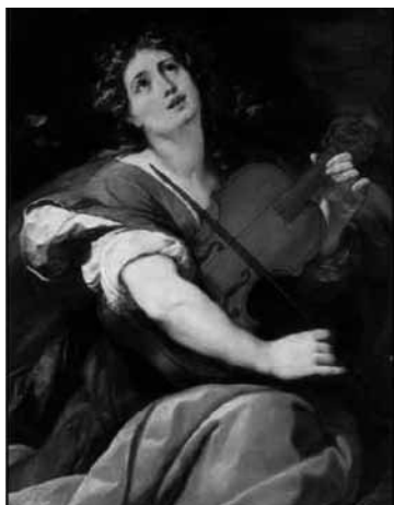
Figura 3. Alegoría de la Música (1610), de Giulio Cesare Procaccini, muestra a una joven (alegoría de la música) tocando un violín.

Sin embargo, la imagen de la mujer como instrumento parece hacer referencia a otra tradición más amplia: la de las alegorías de la música. Desde la Edad Media se representaba a la Música personificada en una joven a menudo tocando un instrumento de cuerda; muy frecuentemente un violín, una lira o una cítara.