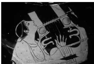
Figura 2. Detalle de una vasija ática, 490-470 a.C, anónimo.

Como nos comenta Ausoni (2006: 251), los responsables del arte de la "citarodia" estaban a menudo ligados a fines rituales; generalmente, en las vasijas griegas la postura de la cabeza mirando hacia el cielo era señal de inspiración poética, como se puede ver en la Figura 2. Rojas, pues, acompaña su poema con el tañer de la cítara, imprimiéndole un carácter musical y un ritmo, pero representando a su vez en el instrumento a la mujer y su belleza, recuperando un tiempo mítico. Contamos ya con varios elementos claves en la poesía de Rojas: el ritmo, la mujer y la belleza, la inspiración.