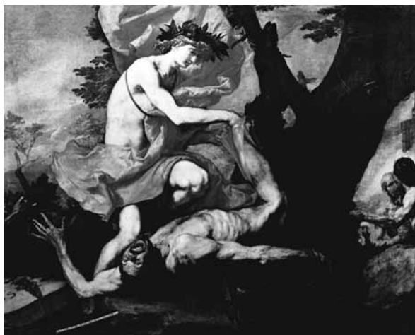
Figura 7. Apolo y Marsias (1637), de José de Ribera, muestra el mítico combate entre el dios y el sátiro.