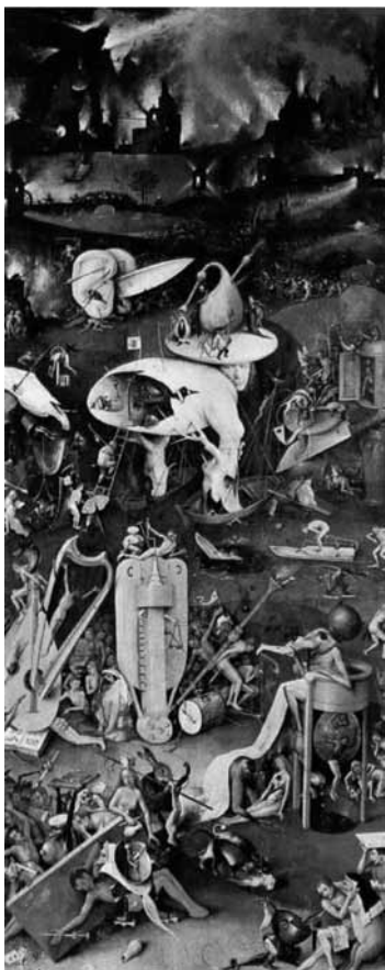
Figura 11. En el infierno del Jardín de las Delicias (finales del siglo XV), los condenados son torturados por cacofonías procedentes de instrumentos gigantescos.